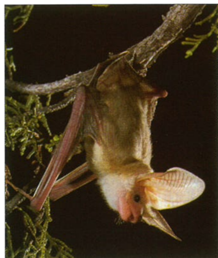
Grootoorvleermuis. Een vleermuis "ziet" met zijn oren. Hij maakt zeer hoge piepgeluiden. Door te luisteren naar de echo weet hij zelfs het kleinste vliegje te vangen.

Ons gehoor is erg gevoelig. Al te sterke geluiden kunnen nare gevolgen hebben. Bijvoorbeeld door een walkman steeds keihard aan te zetten. Je kunt er op den duur zelfs doof door worden. Sommige mensen, vooral ouderen, zijn een beetje doof. Anderen horen heel slecht. Ze zijn slechthorend of hardhorend . Ze hebben een gehoorapparaat nodig. Ook zijn er mensen die helemaal doof zijn. Die spreken